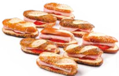
MALICETTES x9 15€