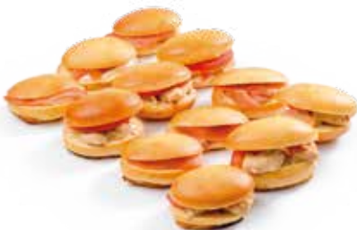
NAVETTES x12 20€