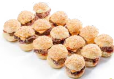
MINI-BURGERS x15 20€