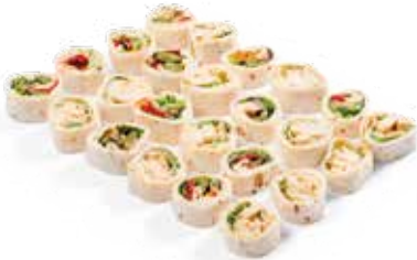
MINI-WRAPS x24 20€