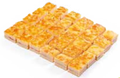
MINI-CROQUES x30 25€