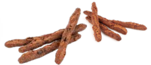
DIABLOTINES x1 1€