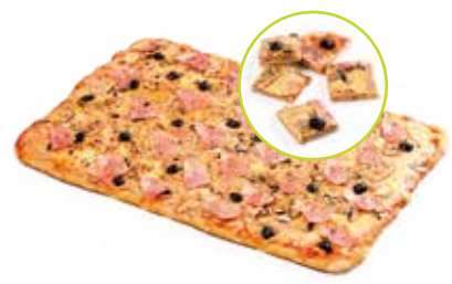
PLAQUE PIZZA 24 parts 30€