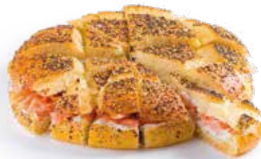
APÉR'ANGE 16 parts 14€