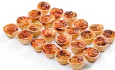
MINI-QUICHES x24 30€